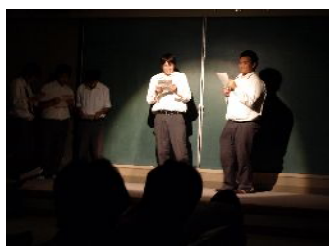
昨年は現代文(2年次)で夕鶴の朗読会を行いました。 照明や音響が雰囲気盛り上げます。